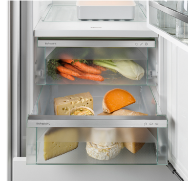
Meat & Dairy rekesz

Ropogós saláta vagy eper: az érzékeny élelmiszerek különleges törődést igényelnek, hogy tovább frissek maradjanak. Erről gondoskodnak a BioFresh rekeszek. A „Fruit & Vegetable rekeszben” 0 °C-hoz közeli a hőmérséklet. A tartós páratartalomnak és szoros zárásnak köszönhetően itt különösen jól érzik magukat a csomagolatlan gyümölcsök és zöldségek. Semmit nem kell beállítania.