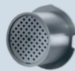
活性炭过滤器 产品编号: 988129100