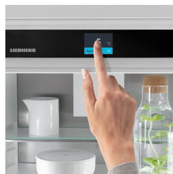
Displej Touch & Swipe

Optimálně osvětlený vnitřní prostor vás potěší: Světla LightTower ukáží potraviny v tom nejlepším světle a jsou umístěna tak, aby osvětlila vždy celou plochu vaší plné chladničky. Jelikož jsou světla LightTower integrována do bočních stěn, zůstane navíc dostatek prostoru pro vaše potraviny.