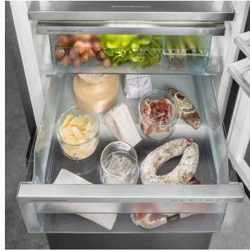
Meat & Dairy rekesz

Ropogós saláta vagy eper: az érzékeny élelmiszerek különleges törődést igényelnek, hogy tovább frissek maradjanak. Erről gondoskodnak a BioFresh rekeszek. A „Fruit & Vegetable rekeszben” 0 °C-hoz közeli a hőmérséklet. A tartós páratartalomnak és szoros zárásnak köszönhetően itt különösen jól érzik magukat a csomagolatlan gyümölcsök és zöldségek. Semmit nem kell beállítania.