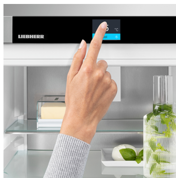
Touch & Swipe kijelző

Az optimálisan megvilágított belső térben örömet fogja lelni: a LightTower elemek előtérbe helyezik az élelmiszereket, és úgy vannak elhelyezve, hogy mindig maradéktalanul megvilágítsák a feltöltött hűtőszekrényt. Mivel a LightTower elemek az oldalfalak síkjában vannak beépítve, több hely marad az élelmiszerek számára.