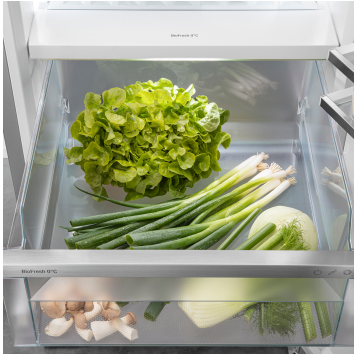
Fruit & Vegetable rekesz

Ropogós saláta vagy eper: az érzékeny élelmiszerek különleges törődést igényelnek, hogy tovább frissek maradjanak. Erről gondoskodnak a BioFresh rekeszek. A „Fruit & Vegetable rekeszben” 0 °C-hoz közeli a hőmérséklet. A tartós páratartalomnak és szoros zárásnak köszönhetően itt különösen jól érzik magukat a csomagolatlan gyümölcsök és zöldségek. Semmit nem kell beállítania.