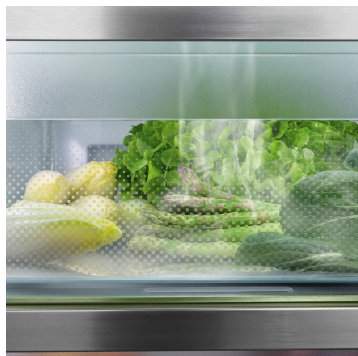
BioFresh s HydroBreeze

Chcete chládiť ovocie a zeleninu ako profesionáli? HydroBreeze vás očarí: Chladná hmla v kombinácii s teplotou tesne nad 0 °C v priečinku sa postarajú o to, aby potraviny vydržali dlhšie. A tiež im dodajú vzhľad, pri ktorom zostanete v nemom úžase. HydroBreeze sa aktivuje každých 90 minút na 4 sekundy a na 8 sekúnd pri otvorení dverí.