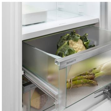
Priečinok na ovocie a zeleninu

Chcete chladit ovocie a zeleninu ako profesionáli? HydroBreeze vás očarí: Chladná hmla v kombinácii s teplotou tesne nad 0 °C v priechniku sa postarajú o to, aby potraviny vydržali dlhšie. A tiež im dodajú vzhľad, pri ktorom zostanete v nemom úžase. HydroBreeze sa aktivuje každých 90 minút na 4 sekundy a na 8 sekúnd pri otvorení dverí.