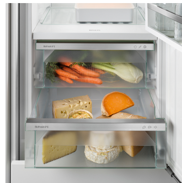
Meat & Dairy rekesz

Ropogós saláta vagy eper: az érzékeny élelmiszerek különleges törődést igényelnek, hogy tovább frissek maradjanak. Erről gondoskodnak a BioFresh rekeszek. A „Fruit & Vegetable rekeszben” 0 °C-hoz közeli a hőmérséklet. A tartós páratartalomnak és szoros zárásnak köszönhetően itt különösen jól érzik magukat a csomagolatlan gyümölcsök és zöldségek. Semmit nem kell beállítania.