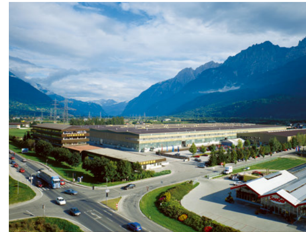
Liebherr Appliances facility in Lienz, Austria