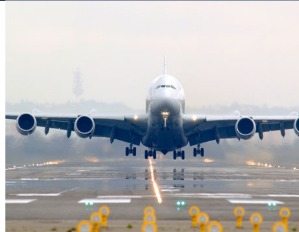
Aerospace and Transportation Systems