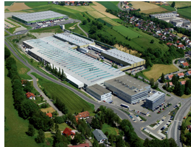
Liebherr Appliances facility in Ochsenhausen , Germany