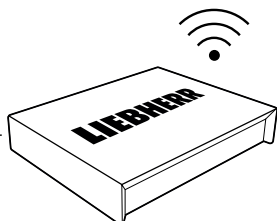
SmartCoolingHub Collecte de données et communication avec services Cloud